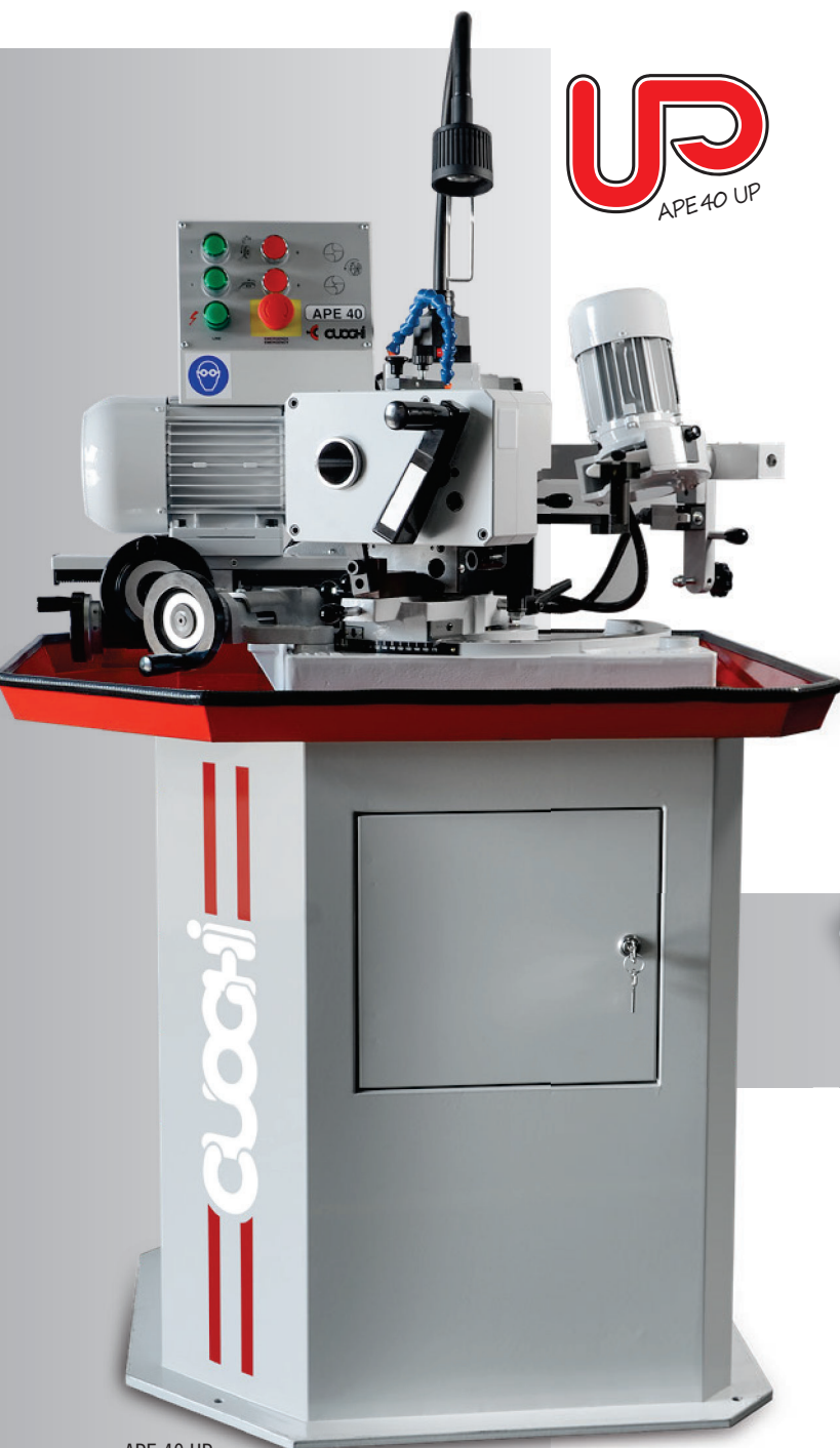
APE 40 UP